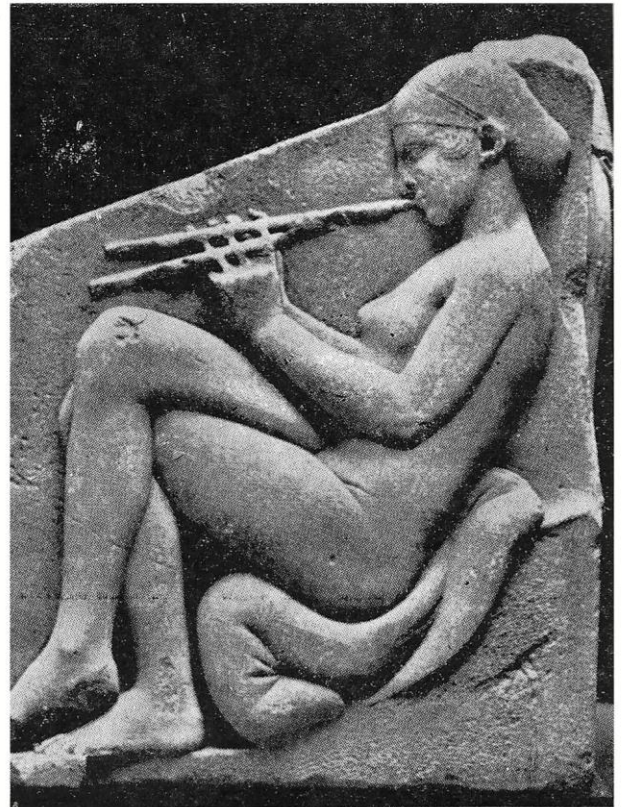
Otro costado del mismo trono con la clásica figura de mujer tocando la flauta.

Así diciendo, llegaron a casa de Donizetti. Entraron a una sala atisgada por el humo enrarecido de cigarro y un denso olor a café, y mientras Gaetano, con un silencio