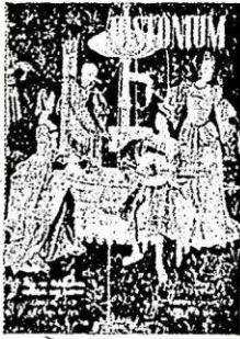
NUUESTRA PORTADA: EL CONCIERTO (Fragmento de un gobelino del siglo XVI).